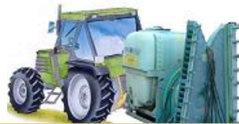
Hidráulico de barras