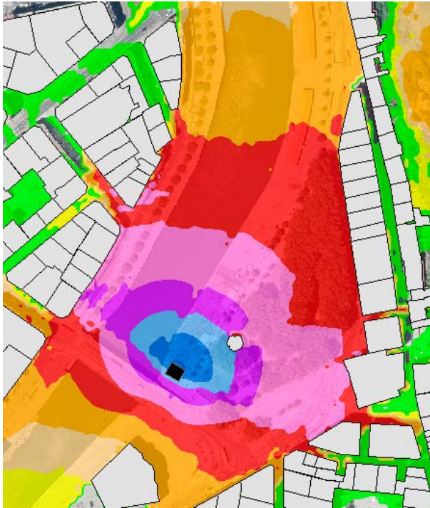
Areatza, 1. banaketa