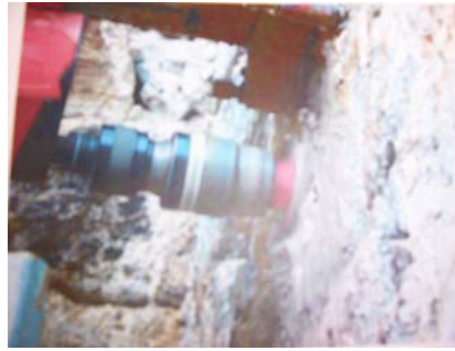
Extracción de muestra

Tras ese trabajo de campo, de inspección visual de la torre, los técnicos acometieron otra labor, la de laboratorio.