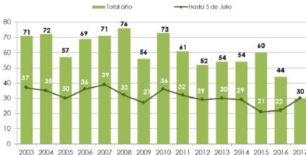
Víctimas mortales por Violencia de Género. De 1 de enero de 2003 hasta 5 de Julio de 2017