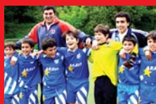
Bizkaiko eskola jolasak, iruditan