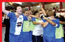
Los equipos de Bizkaialde, uno a uno