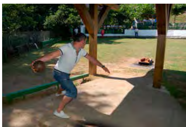
Figura 10. Bolari tirando en el carrejo de Zubitxu (El Regato), 15.08.2009.

El bolari, tras limpiar y secar la bola, para poder controlarla mejor, sujeta ésta con la mano extendida, apoyando sobre la piedra de tire el pie del mismo lado que la mano a utilizar; extiende su brazo hacia atrás y lanza con fuerza la bola contra los bolos armados sobre el taco.