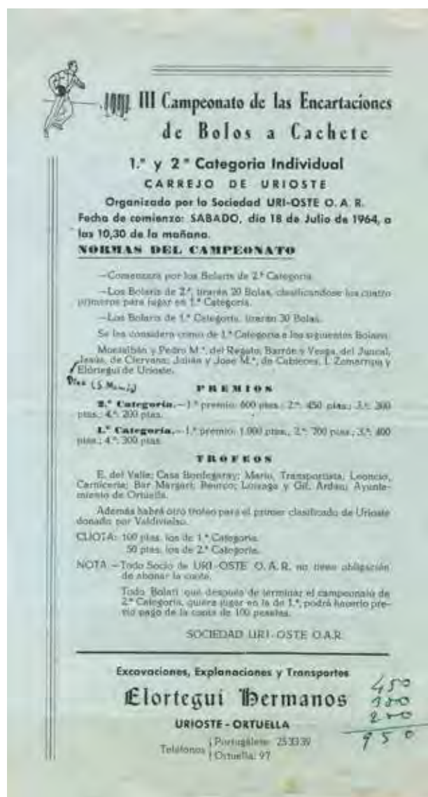
Figura 11. Programa del III Campeonato de las Encartaciones de bolos a cachete (1964), celebrado en Urioste.

Las primitivas bolas fueron de encina o de roble como, por ejemplo, en el tablón del carrejo de El Juncal, donde tanto los bolos como el tablón eran también de madera de encina. Hacia 1929 comienzan a elaborarse sistemáticamente bolas de guayacán, madera exótica de café oscuro que ya se utilizaba en la construcción naval en las empresas de la zona, duras y resistentes. Aunque