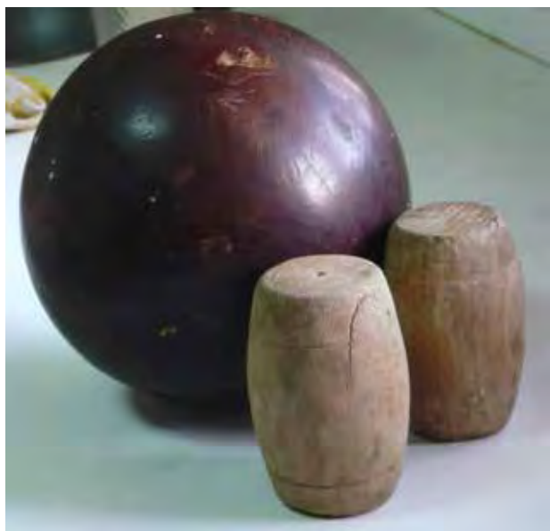
Figura 12. Bola esférica torneada y bolos antiguos, en forma de barrilete.