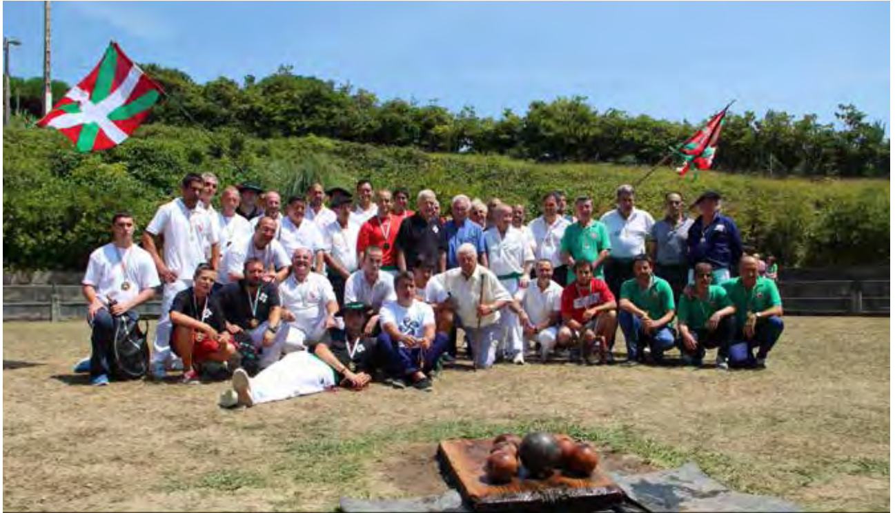
Figura 21. Participantes en el Torneo Interpueblos, celebrado en el carrejo zierbanato de La Arena (2014).

(Homenaje a Federico Besga e Ino Zamarripa), en La Arena; el XXIV Campeonato de Euskadi de Veteranos (27.07 y 2.08), en El Regato; el Desafío al Campeón (3.08), en Durañona; el Gran Premio Memorial "El Nene" (23 y 24.08) en El Regato, con final a 40 bolas; las Competiciones femeninas (27.07, 5.08, y 30.08), en La Arena y Durañona; las Competiciones Infantiles (junio en Urioste y agosto en Durañona) 117 , el Día del Katxete Eguna (20.09), competición infantil, en La Cuesta; el II Campeonato de Euskadi Femenino, en La Cuesta; y el II Campeonato Femenino (20.09), en La Cuesta. Paralelamente a este calendario de campeonatos y competiciones está el de concursos a 3 bolas, que coincide con los desafíos por parejas y las fiestas celebradas en los barrios con carrejo 118 .