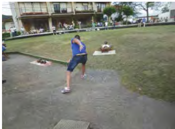
Figura 6. Semipanorámica del actual carrojo de Sanfuentes.

En el carrojo podemos distinguir tres partes diferenciadas. Delante del terreno de juego se encuentra la primera de ellas y propiamente dicha. Se trata de una piedra de forma trapezoidal y plana, encachada en el suelo y denominada tire , donde el jugador afianza el pie al lanzar la bola, proporcionando así un mayor impulso a ésta. Sus dimensiones, variables según carrojos, son de 46 cm. de longitud, 74,9 cm. de ancho por su base superior, 76,7 por la inferior, 59 cm. de ancho y 6,7 cm. de desnivel a modo de promedio 60 (Reglamento: 70X50 cm.). Este tire se viene realizando de cemento o de hormigón, ya que estos materiales ofrecen mayor adherencia –que el simple suelo de tierra o de hierba– para que el jugador afiance su pie.