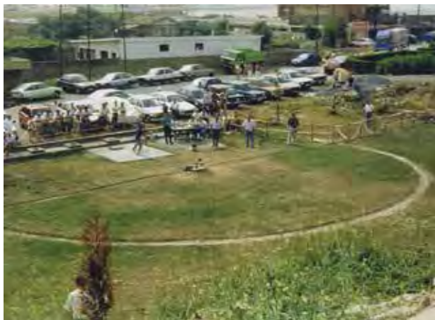
Figura 5. Panorámica del campo del carrojo de La Arena (1989), durante el Campeonato de Euskadi.