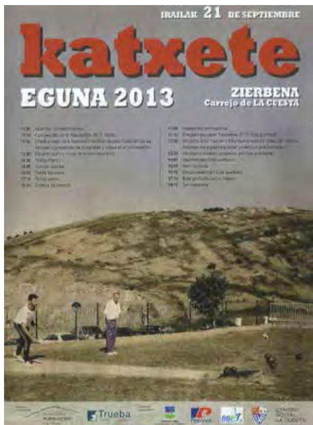
Figura 19. Programa del Katxete Eguna de 2013, en el carrojo de La Cuesta.