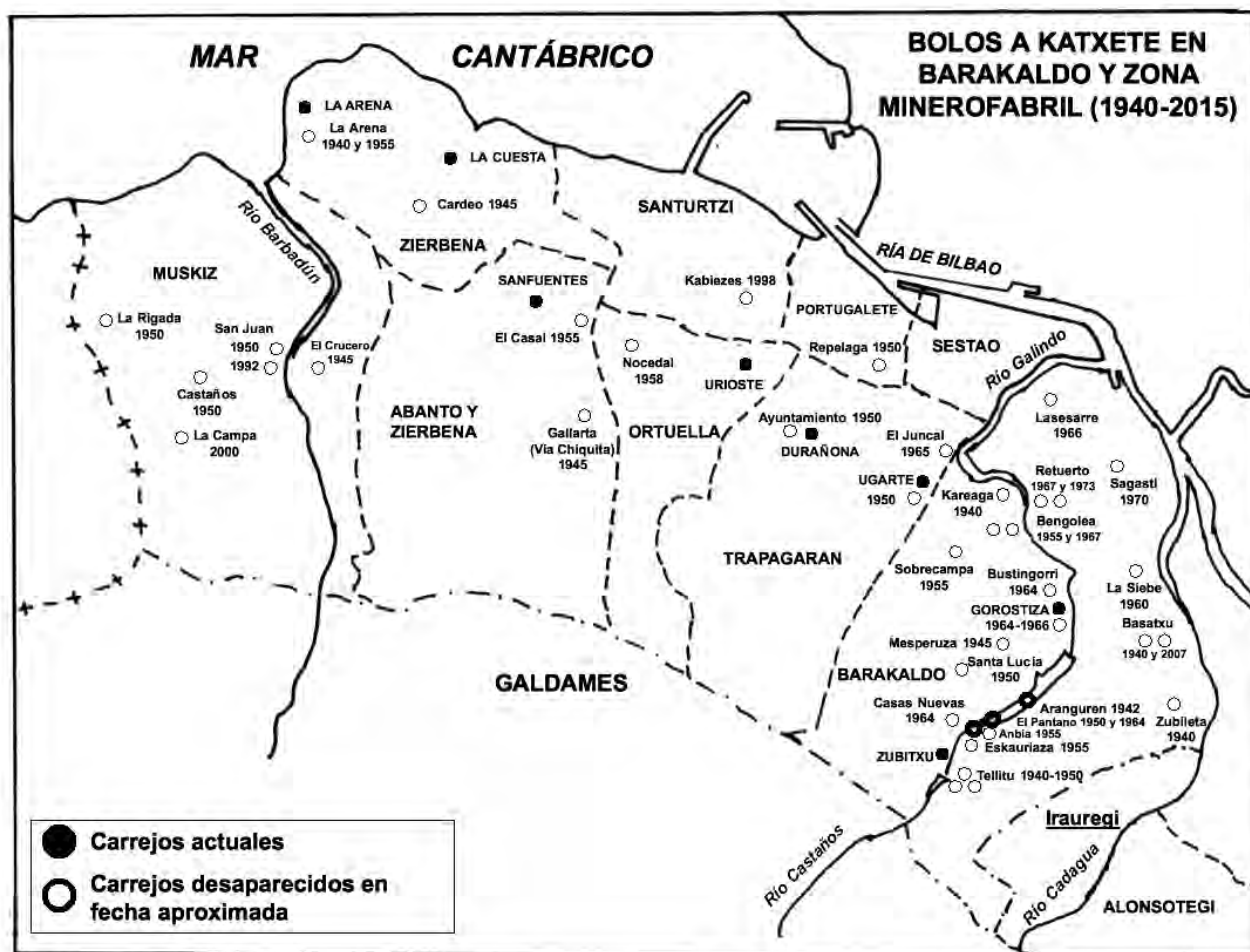
Figura 2. Carrejos de bolos a katxete (1940-2015), en Barakaldo y en el resto de la Zona Minerofabril.

la zona alta o El Regato propiamente dicho. En Tellitu hubo una verdadera proliferación de carrejos 34 , en su mayor parte pequeños, como corresponde a la accidentada topografía de este somo montesino, y de tipo juvenil con bola de encina. Pero los jóvenes pastores y carboneros de esta barriada incluso construyeron otros dos carrejos en pleno monte, a poco de finalizar la Guerra Civil 35 . Se recuerdan otros once en el núcleo de El Regato 36 , de los que tan