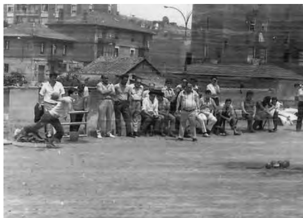
Figura 3. Carrejo de Kabiezes (Los Llanos), clausurado en 1998.

Abanto-Zierbena 53 . Otros doce en el de Muskiz 54 (Ibabe 1987: 110-111; Homobono s/d.).