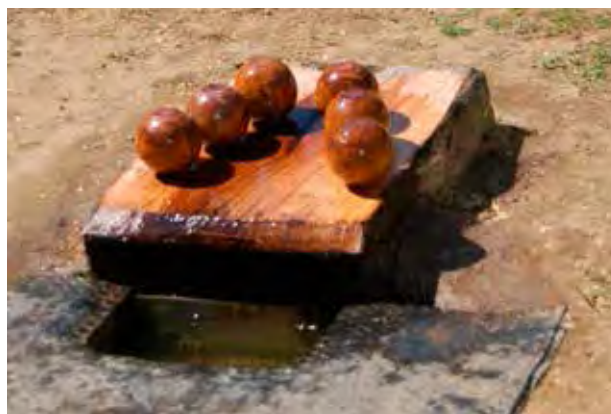
Figura 9. Bolos armados sobre el taco en el carrejo de Zubitxu (El Regato) (15.08.2009).

polos, con objeto de facilitar su apoyo en el taco. Con un diámetro entre 10 y 13 cm., su peso está normalizado, oscilando entre los 1.020 y los 1.200 gr. de peso, aunque la tendencia apunta hacia los pesos más bajos a partir de los primitivos en torno a los 1.250 gr. (Reglamento: 900-1.1100 gr.). Los utilizados por los jugadores juveniles pesan entre 675 y 800 gramos. Suelen tener una base de 5 cm. y una altura de 9 cm.