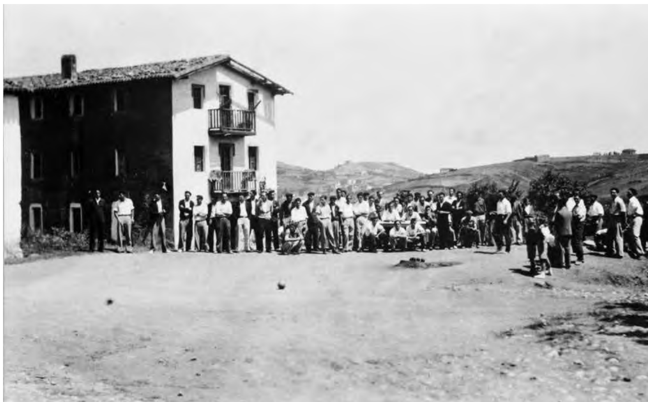
Figura 13. Partido en el viejo carrejo de Urioste (años cuarenta).

Tras el lapso bélico, es preciso esperar a los años 1944-1947 para que las fuentes documentales hagan referencia a nuevos concursos de bolos a katxete . Aunque el Gobierno Civil de Bizkaia organiza, entre 1945 y 1947, el Campeonato de España por Parejas , disputado en Kabiezes y Repelaga. A partir de 1940 se incrementan los desafíos e irrumpe una nueva generación de bolaris, siendo Gorostiza lugar de cita obligado puesto que, en 1944, 33 vecinos del barrio compran un terreno, pagando cada uno la cuota de una peseta, durante nueve años. Los concursos reaparecen en El Regato, en el carrejo de Zubitxu, referencia que no aflora de nuevo hasta 1955 y no vuelve a hacerlo hasta bien mediada la década siguiente. Lo propio sucede en Retuerto por sus fiestas, aunque en este caso la incorporación del concurso de bolos al programa es más tardía -1944/1946-, en el carrejo de Bengolea, jugándose el día de San Ignacio y el de su repetición en el de El Molino. La desaparición de estos carrejos implica una prolongada ausencia de campeonatos en el programa festivo de Retuerto.