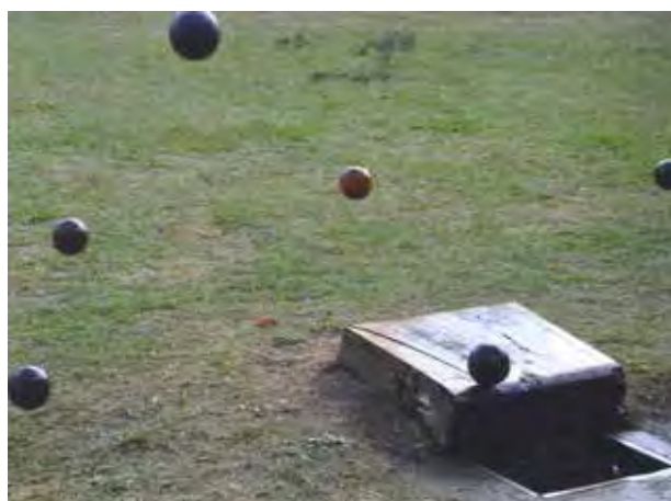
Figura 7. Bola impactando sobre los bolos en el carrojo de Durañona (17.08.2013).

Una tercera zona es el terreno de juego propiamente dicho o campo , de forma semicircular, en el que existen dos semicírculos concéntricos o rayas , cuyo centro es la base del taco , por el que