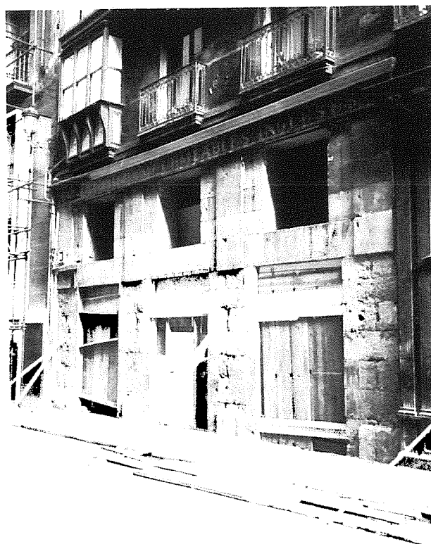
UNA VEZ LIMPIADOS LOS ENCUBRIMIENTOS Y APLACADOS QUE LA OCULTABAN