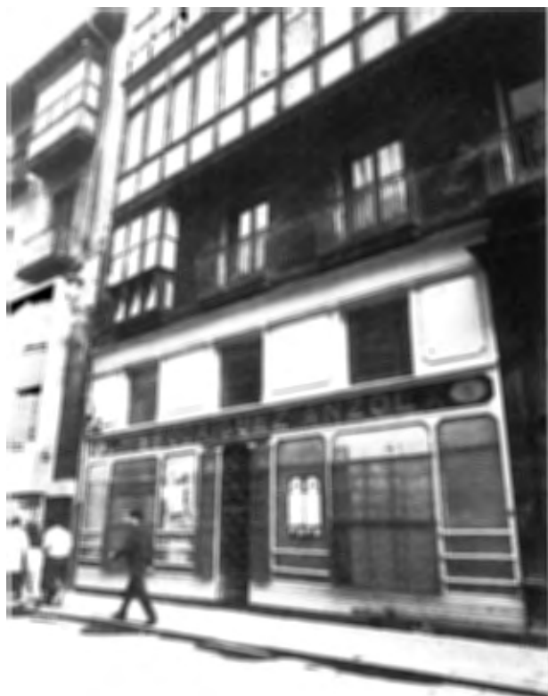
ESTADO INICIAL DE LA FACHADA

escaparate y montante sobre el que se coloca el rótulo comercial siendo su principal misión el hacer de frente de caja de persiana. Nosotros evitamos esta solución, recurriendo a empotrar la persiana entre el montante del escaparate y el forjado de la primera planta con lo que creímos ganar en originalidad y transparencia.