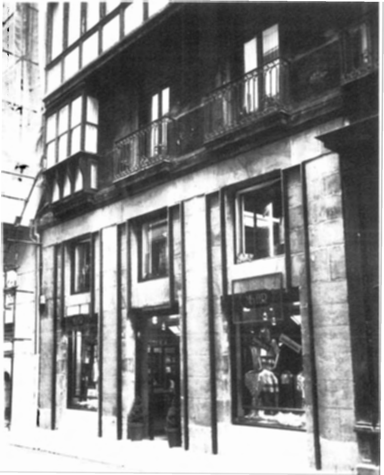
ESTADO ACTUAL DE LA FACHADA (FINAL)