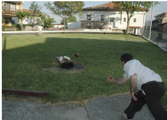
Bola jokoa Cachete-ra • Juego de bolos a Cachete

Kontua edo helburua lau kilo inguru dituen bola batekin bolo biribil batzuk —lau eta sei artean— sendo jotzean datza. Bolo horiek tako baten gainean daude jarrita, hain zuzen ere zirkuluerdia forma