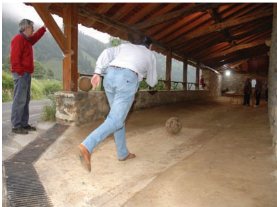
Goitanako bolatokia • Bolera de Goitana . Mallabia