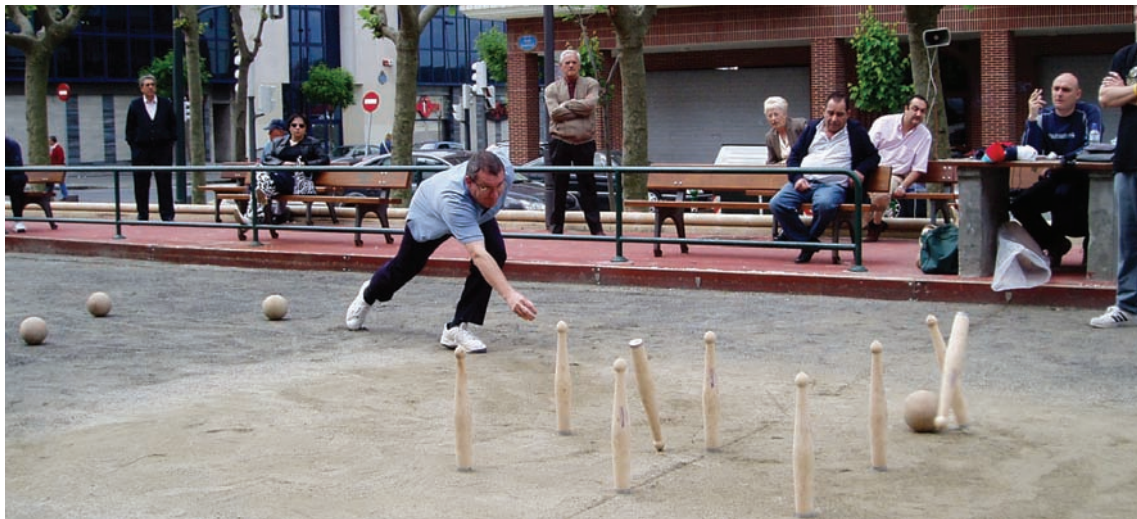
Inazio deuna auzoko bolatokia • Bolera de San Ignacio . Bilbao. © Juan José Zorrilla

remonte con muna entre los bolaris del Duranguesado y el nacimiento de clubes como el club Nervión de Basauri de bolo burgalés.