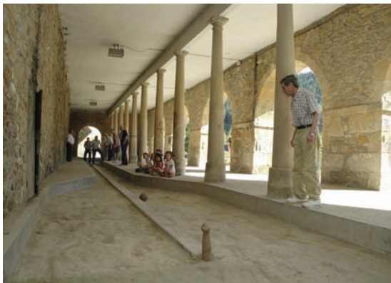
Arabar boloa edo Lautadakoa Bolo alavés o de la Llanada