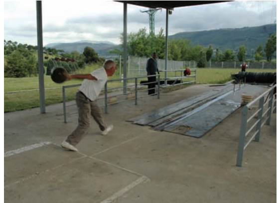
Obako bolatokia • Bolera de Oba . Dima

Bolo arin eta simetrikoak erabiltzen dira, 35 cm-koak eta puntan bukatzen direnak, alegia. Bola euskarriduna da eta 5 eta 7 kilo artekoa izaten da. Gaur egun asko jokatzen da Bizkaiko eta Kantabriako federazioen barruan.